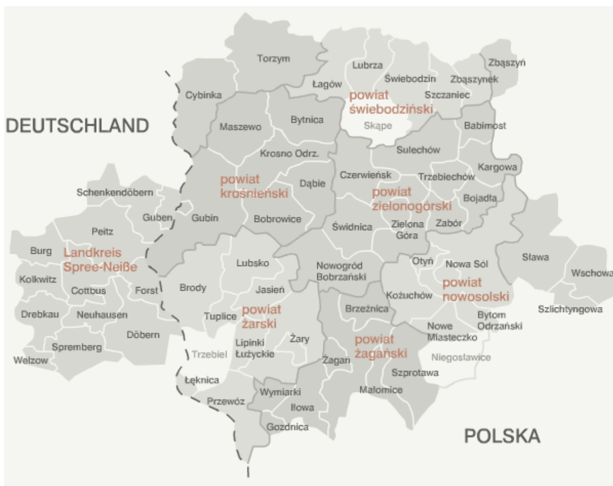
Rysunek 1. Euroregion „Sprewa-Nysa-Bóbr” stan na grudzień 2011 r.